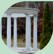
III Фирменная ротонда