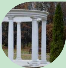
III Фирменная ротонда